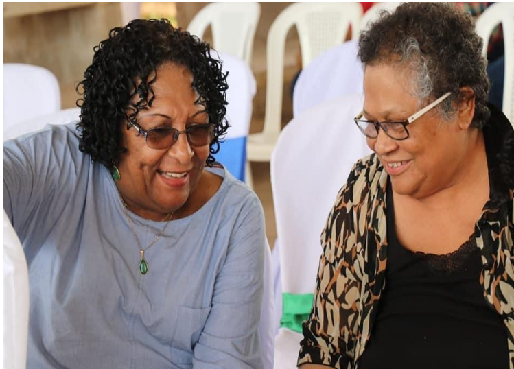
Líderes indígenas de la Costa Caribe Norte

En nuestro contexto hay una interpretación errónea del concepto de equidad de género, muchos interpretan que se trata de igualdad biológica entre el hombre y la mujer. La equidad de género se refiere al trato igualitario para ambos géneros, sin embargo, no hay claridad en este concepto, hay hombres que quieren tratar a las mujeres como hombres, algunos rechazan darles un trato cortés y amable, ejemplo cuando ellos viajan en el transporte público, no le ceden su asiento a mujeres embarazadas ni de la tercera edad, aduciendo la igualdad de género.