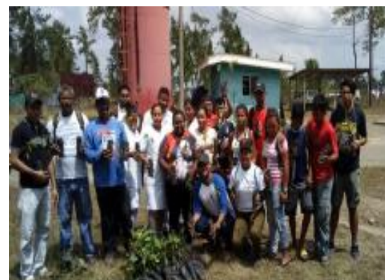
Realizando actividad de reforestación sin distinción de género

La práctica común que se nos ha inculcado desde el hogar, consiste en que es al padre a quien se le sirve primero la comida, pero también es él quien debe comer el mejor bocado. De igual manera es el padre quien se responsabiliza de la educación del hijo varón por su carácter dominante y fuerte. Y sobre todo se pensaba que al hijo varón debía tratarse fuertemente y realizar trabajo de “hombre y no tareas de mujer “porque esto les afectaría hasta en sus actitudes como varón. Desde esta perspectiva en la sociedad misquita es el varón el que ejerce e impone el poder sobre las mujeres y la naturaleza, fortaleciendo así el sistema del patriarcado. Se tiene que pasar por un proceso de reflexión y concientización que contribuya a la deconstrucción real de los pilares que sostienen este patriarcado, que lo legitima no solo el ámbito familiar, sino el social, el religioso, el laboral y familiar.