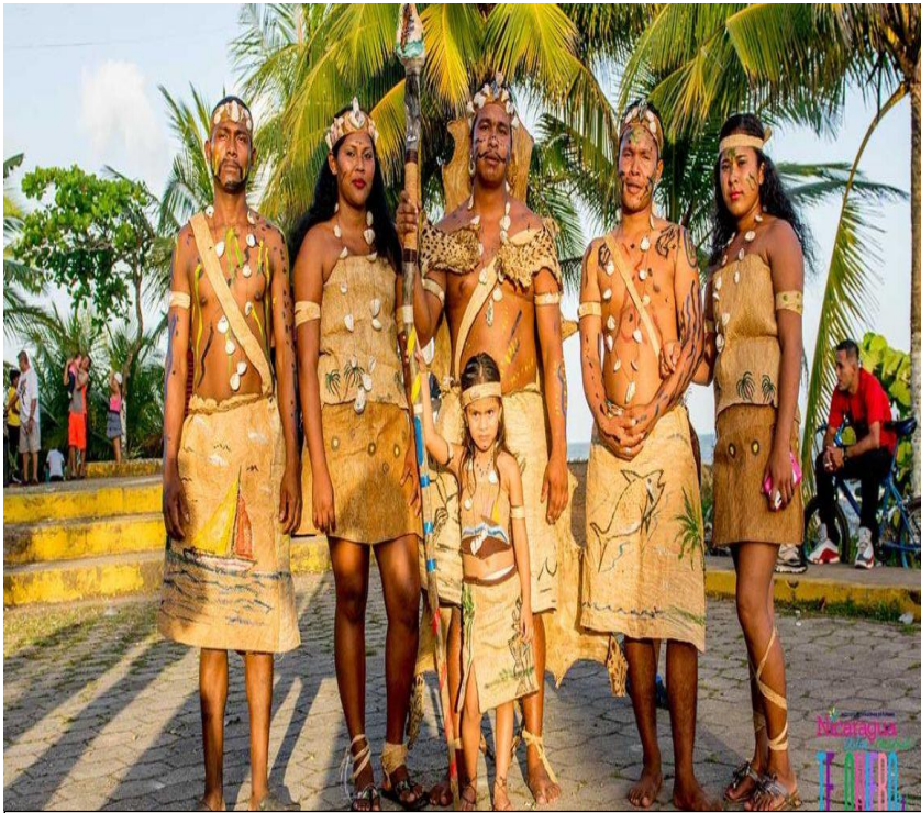
Presentación cultural representando al Rey misquito y sus súbditos