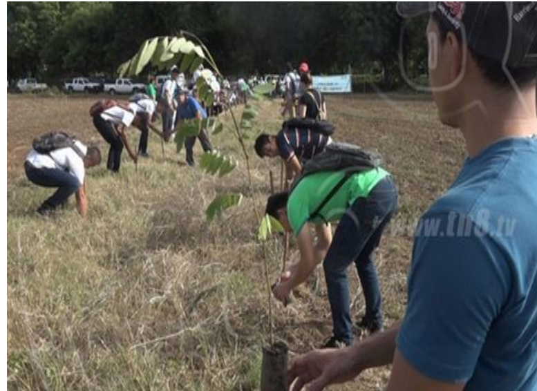
Aprendientes realizando actividad de reforestación en áreas verdes

acaparar su gracia y su bravura. ¡Vos sos la más constante pesadilla que ha de tener el polvo en su aventura! Rafael Mendoza Octubre, 1972.