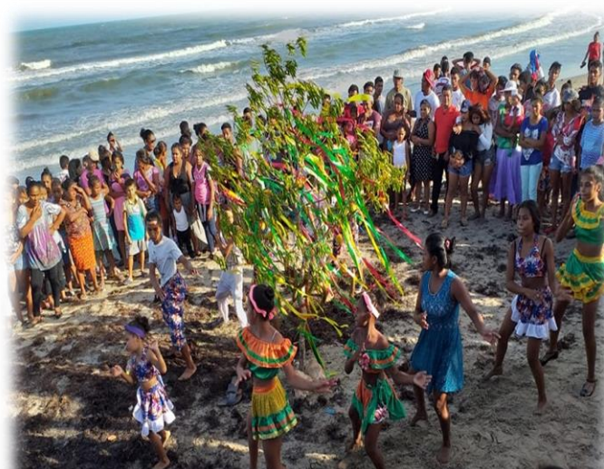
Danza de nuestra región típica de nuestra cultura

En consecuencia a esta práctica patriarcal que ya hemos venido mencionando como lo es en la toma de decisiones desde el hogar, respecto a la educación, por ejemplo la imposición a sus hijos en la selección de carrera a optar en la educación superior, en la conformación de liderazgos comunales que desde nuestro sentir violentan los derechos de las mujeres. Estos derechos son violentados por considerar que la mujer posee un carácter débil que le limita en la toma de decisiones y liderazgo en la sociedad. Ante esta situación, nos hemos motivado a abordar y reflexionar alrededor de este tema con el propósito de contribuir a un cambio sustancial en la manera de pensar y actuar de la población misquita a través de los nuevos paradigmas.