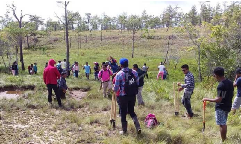
Aprendientes de la universidad BICU contribuyendo con la reforestación en áreas desforestada

La vida humana es posible si se respeta y se mantiene la armonía del circuito naturaleza-sujeto-sociedad. No hay vida posible si no se educa en una relación responsable y de calidad del hombre con la naturaleza, consigo mismo y con los otros seres humanos. El desarraigo, la división y la negación de este circuito natural significan la muerte. Morín (2001:12).