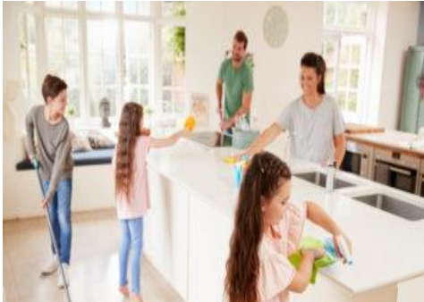
Desde la familia realizando actividades sin distinción de roles

De acuerdo a la Ley 648: Ley de igualdad de derechos y oportunidades; en el Artículo 3, inciso f define el término Equidad